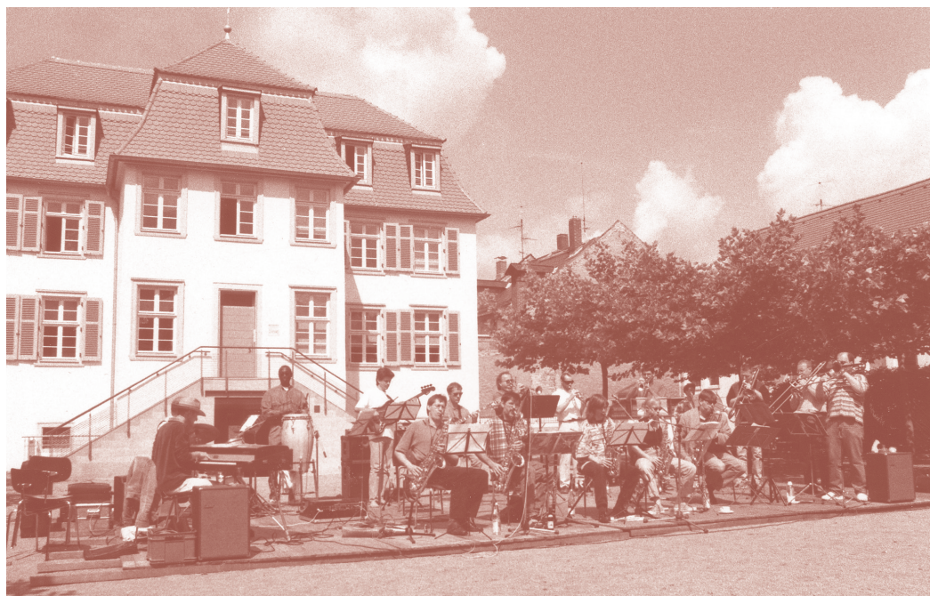
Concierto a las puertas del Jazzinstitut.