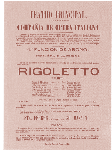
Copiadore de Carta. detalle del índice de nombres. Libro15 (Libro 6 Caja 2) / Diario de Cuentas de Propiedad de Comedias 1884-1891 (Libro 45 Caja 13) / Programa del Teatro Principal de A Coruña.