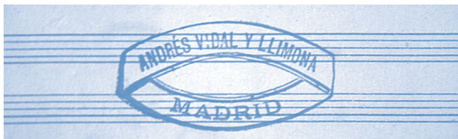
Sello del establecimiento de Andrés Vidal y Llimona en Madrid Fondo Vidal Llimona y Boceta ©ICCMU

En primer lugar, encontramos las etiquetas de la primera etapa de Vidal y Llimona en Madrid, cuando se establece por cuenta propia.