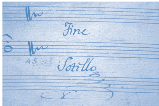
Firma del posible copista Sotillo Fondo Vidal Llimona y Boceta ©ICCMU

Los libretos de muchos ejemplares se encuentran traducidos al castellano, bien superponiendo el texto al libreto en italiano o solamente en castellano. Junto a todas las frecuentes traducciones de óperas de Rossini, se encuentra siempre la firma de un tal Sotillo, por lo que suponemos que podría gestionar la traducción de los libretos o realizarlos él mismo, por las múltiples coincidencias de la firma de este supuesto copista y traductor con el sello de Vidal Llimona.