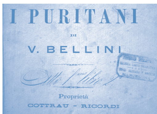
Asociación de las editoriales Ricordi y Cottrau Fondo Vidal Llimona y Boceta

Además de observar la representación de grandes editoriales en otros países, a través del estudio de las etiquetas de editores extranjeros también se asiste al proceso de reorganización del mundo editorial italiano: la editorial milanese Lucca fue absorbida por Ricordi en 1880, por consejo de Verdi, y esta se asoció con la napolitana Cottrau 10 .