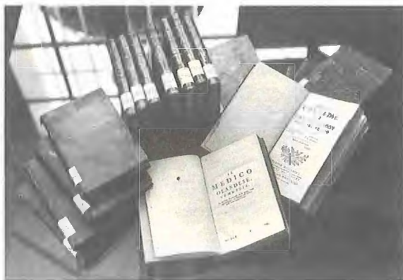
Ilustración 2: Fotógrafo, Luis Castilla (sig. 144)