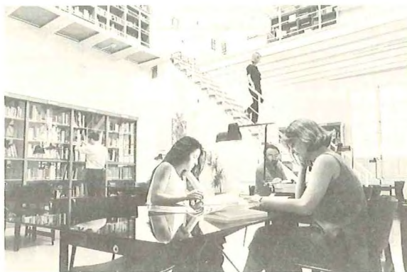
Ilustración 1: Fotógrafo, Luis Castilla (sig. 144)