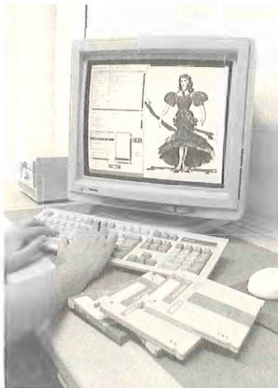
Ilustración 3: Fotógrafo, Luis Castilla (sig. 144)